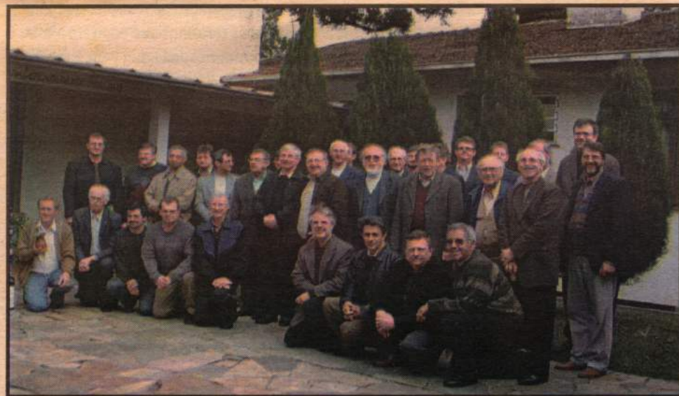
ENCONTRO DE PASTORES SINODAIS E BISPOS, EM CURITIBA/PR