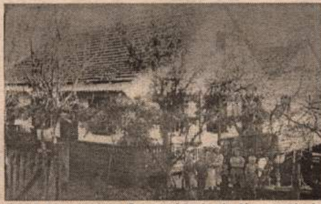
Casa pastoral na Comunidade de Kronenthal

E em janeiro de 1974, a sede da Paróquia passou para a Comunidade de Taperá onde está