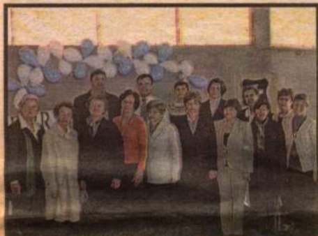
No dia 2 de setembro, a OASE de Panambi Centro festejou os 99 anos atividades