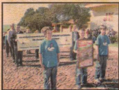
Desfile Cívico no dia 20 de setembro, divulgando os trabalhos da paróquia