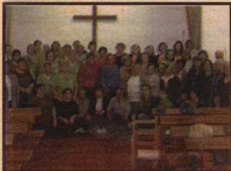
Encontro Paroquial da OASE foi realizado na Comunidade São Mateus (Linha 2 Norte)