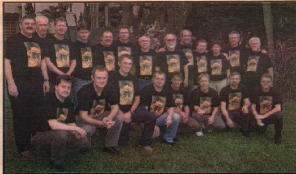
PASTORA E PASTORES SINODAIS COM A PRESIDÊNCIA DA IECLB