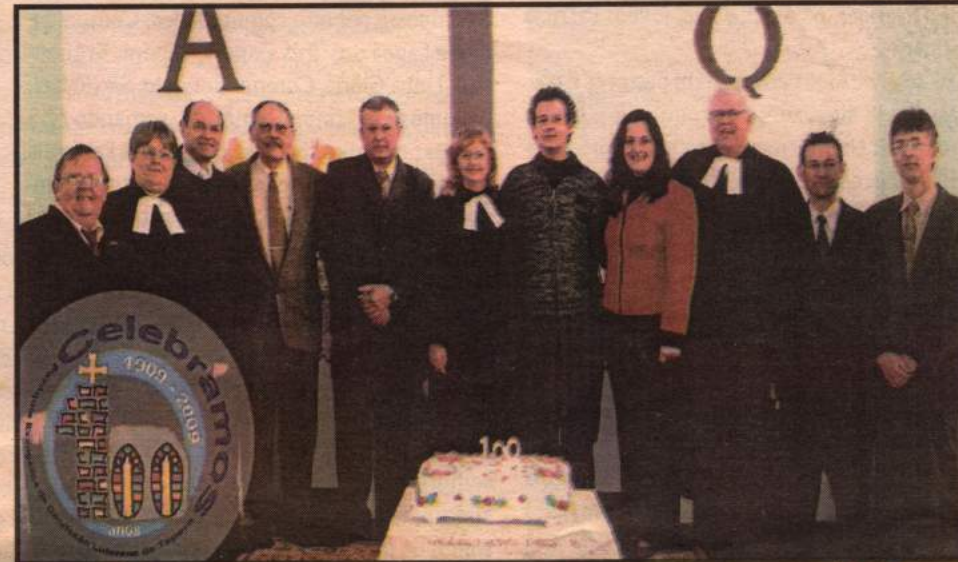
PARÓQUIA EVANGÉLICA DE TAPERA CELEBROU OS 100 ANOS