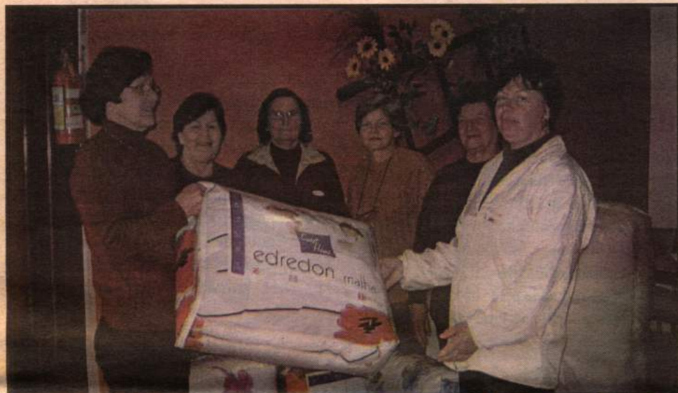
OASE SINODAL FAZ DOAÇÃO PARA O LAR DA IGREJA, EM PANAMBI